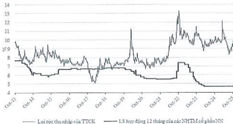
Chênh lệch giữa lợi suất thu nhập của VN Index và lãi suất tiền gửi

Tuy nhiên, nhà đầu tư cần lưu ý một số rủi ro có thể xảy ra như áp lực tỷ giá và lạm phát nếu tăng trưởng tín dụng vượt 16-18% và giá bất động sản tăng quá nóng tại các đô thị lớn; biến động dòng vốn nước ngoài trong giai đoạn chuyển tiếp trước nâng hạng; khả năng thực thi các dự án hạ tầng quy mô lớn và cải cách hành chính tại địa phương; cùng rủi ro chính sách nếu giá bất động sản tăng nhanh dẫn đến các biện pháp siết chặt quy định.