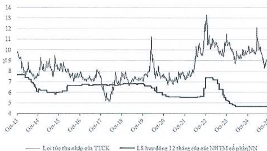
Chênh lệch giữa lợi suất thu nhập của VN Index và lãi suất tiền gửi

Tuy nhiên, nhà đầu tư cần lưu ý một số rủi ro có thể xảy ra như áp lực tỷ giá và lạm phát nếu tăng trưởng tín dụng vượt 16-18% và giá bất động sản tăng quá nóng tại các đô thị lớn; biến động dòng vốn nước ngoài trong giai đoạn chuyển tiếp trước nâng hạng; khả năng thực thi các dự án hạ tầng quy mô lớn và cải cách hành chính tại địa phương; cùng rủi ro chính sách nếu giá bất động sản tăng nhanh dẫn đến các biện pháp siết chặt quy định.