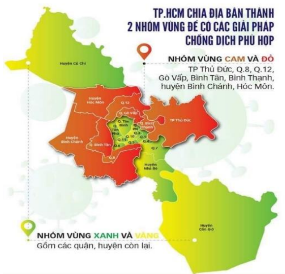
Bản đồ COVID-19 tại TP HCM

Các hãng truyền thông quốc tế cũng đã đưa tin về việc TP HCM sẽ siết chặt hơn các biện pháp phòng, chống COVID-19, bao gồm tạm thời đóng cửa các siêu thị và giao cho quân đội nhiệm vụ phân phối lương thực thực phẩm cho người dân thành phố trong suốt hai tuần giãn cách nghiêm ngặt. Vết thứ hai đã thu hút nhiều sự chú ý vì một số quốc gia khác cũng đã dùng quân đội hỗ trợ phòng chống dịch, tuy nhiên bên cạnh phân phối thực phẩm, lực lượng này còn thực hiện nhiệm vụ bảo vệ sức khỏe cộng đồng, gồm cả việc quản lý 10 trạm xét nghiệm COVID-19 di động.