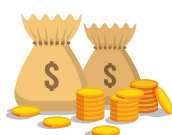
Quỹ đầu tư Cân Bằng Tuệ Sáng VinaCapital (VIBF)